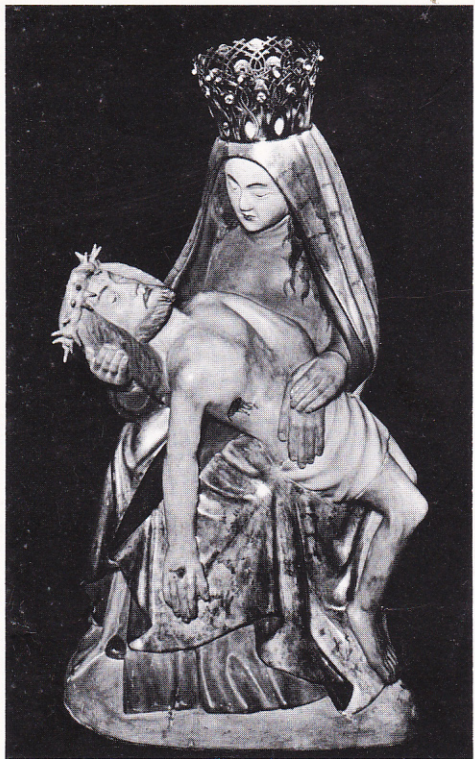
Schmerzhaftes Mutter aus der St. Mariä-Himmelfahrt-Kirche Alstätte